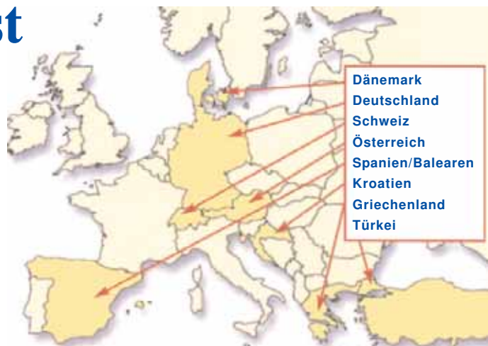
Expansion: YACHT-POOL besitzt nun acht Niederlassungen in Europa