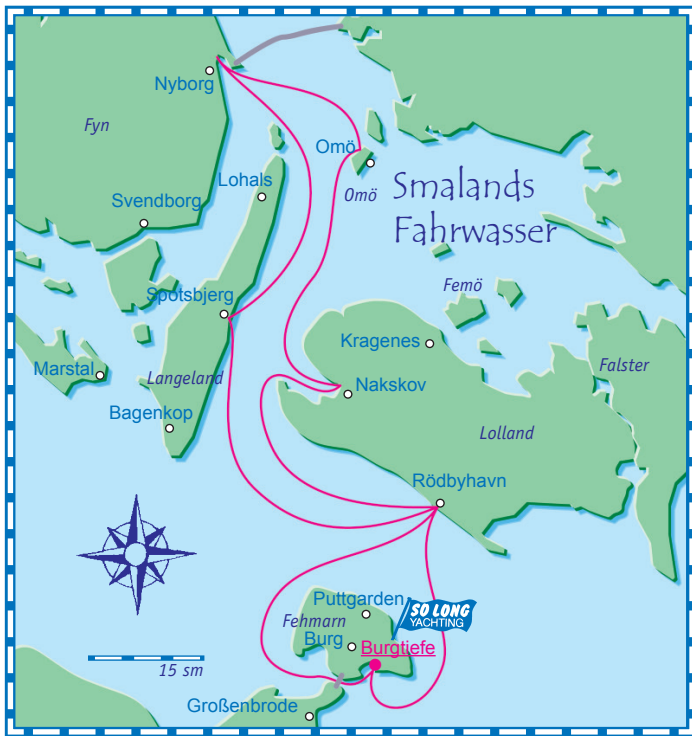
Beliebter Wochentoern von Fehmarn aus - ca. 120 sm

SO LONG YACHTING-Ausrüstungscode©: a.Rollreff-Genua b.Roll-Groß c.Radsteuerung d.UKW-Telefon e.Elekt.Kühlschrank f.220V Landanschluß mit Ladegerät g.Hafenhandbücher deutsch h.Hafenhandbücher englisch i.Hafenhandbücher französisch j.Radio k.Elekt.Ankerwinch l.Elekt.Windanzeige m.Heizung n.Warmes Wasser o.GPS p.GPS-Plotter q.Autopilot r.CD-Player s.Bettwäsche t.Biminitop u.Sprayhood v.Bugstrahlruder ( ) nur auf einigen Yachten vorhanden "-" von bis